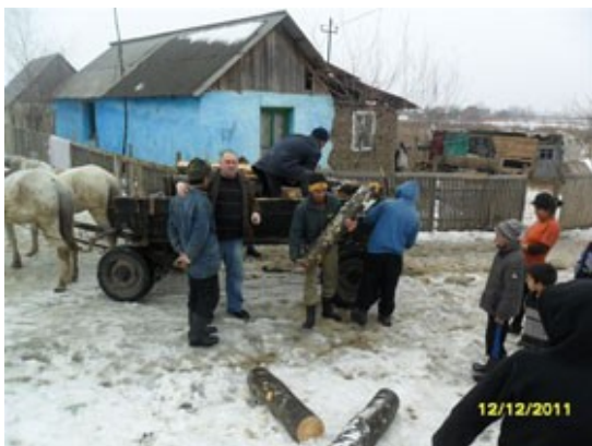
hout voor Roma-zigeuners