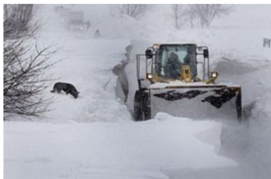
eeuwval in Roemenië